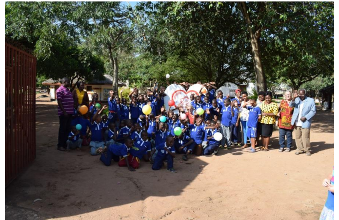
Laatste groepsfoto Upendo Daima

want je gaat terug naar je “eigen” land en verwacht dus dat alles vertrouwd is, maar je houdt geen rekening met het feit dat het leven niet stil heeft gestaan en dat je zelf ook veranderd bent). Al het afscheid nemen is achter de rug en nu is het inpakken geblazen.