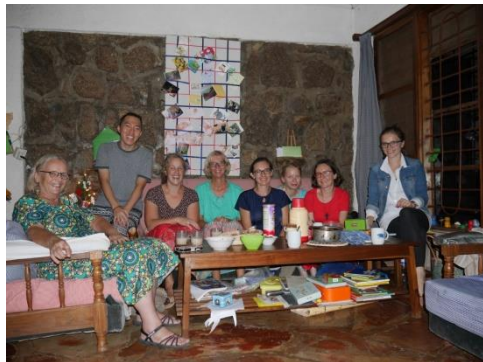
Laatste groepsfoto SMA Lay in Tanzania

Goh, de tijd vliegt toch echt wel. Dit mag dan het land van pole pole zijn (langzaam aan), maar het lijkt wel haast gisteren (nou vooruit, eergisteren) dat ik in dit land aankwam en alles moest gaan uitvinden. Maar het is toch al echt weer vier jaar geleden. Nog even en dan mag ik