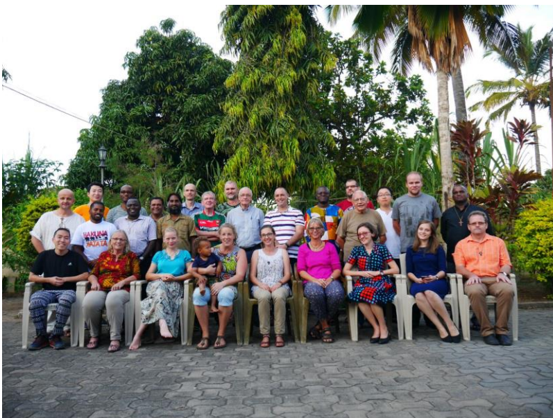
De laatste groepsfoto van de SMA Tanzania

Nou ja, ik kan voor beide categorieën nog wel een tijdje doorgaan, maar dat zal ik niet doen. Aan al het goede komt een eind zegt men, dus aan dit ook. Maar nu is het een kwestie van weer een nieuw goed iets starten in Nederland, en dat zal wel best wel lukken. Het is een mooie ervaring geweest, ik heb veel dingen geleerd en hopelijk heb ik ook wat dingen kunnen leren aan de mensen met wie ik hier samen heb gewerkt. Ik wens iedereen hier in Tanzania het allerbeste en iedereen in Nederland alvast een Zalig kerstfeest en een Gelukkig Nieuwjaar.